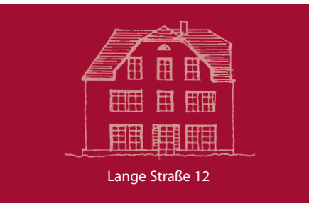
Lange Straße 12