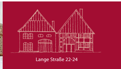
Lange Straße 22-24