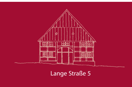
Lange Straße 5