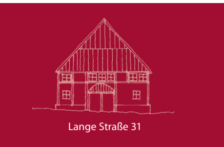
Lange Straße 31